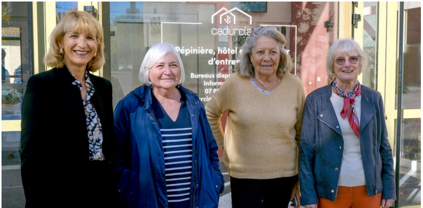
La présidente entourée de membres de l'association. ""

Pas question donc de changer une recette qui marche. Pour la saison 2025/2026, les grands thèmes seront abordés, de la naissance de l'égyptologie à l'histoire du Tour de France.