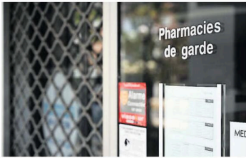
La mobilisation des pharmaciens a été soutenue par les quatre parlementaires lotois.

Programme complet à retrouver sur le site de l'UPTC : uptyc-cahors.org