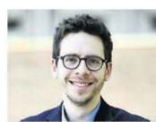
En présence du député LFI Hadrien Clouet