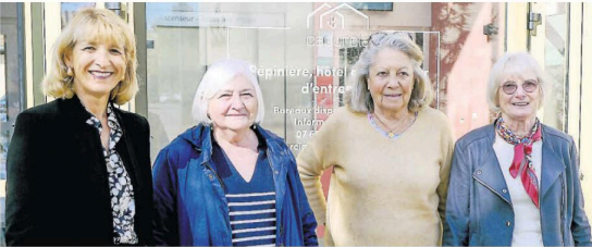
La présidente entourée de membres de l'association

Pas question donc de changer une recette qui marche. Pour la saison 2025/2026, les grands thèmes seront abordés, de la naissance de l'égyptologie à l'histoire du Tour de France. « Tous les intervenants sont bénévoles et experts dans leur domaine. Si nous privilégions les conférences locales, nous avons de plus en plus d'enseignants-chercheurs des universités Paul Sabatier et Jean Jaurès ou venant de Sciences-