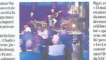
Un voyage musical avec le trio Rapsody.