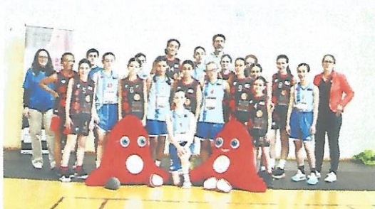
Les U13 de Pradines Lot Basket et Montech réunies devant les mascottes des JO de Paris 2024.

Ce mercredi 1 er mai, au palais des sports de Cahors, le comité Quercy Garonne de basket organisait les finales des catégories jeunes du territoire (U13 F et G, U15 F et G, U18 F et U17 G) sur la journée, en collaboration avec le club de Cahorsauzet Basket. Les rencontres débutaient dès 9 h 30, avec les U13 féminines de Pradines Lot Basket opposées à Montech ; à 11 h 15, c'était au tour des U13 masculins de Montauban de jouer contre Caussade ; à 13 heures, les U15 F de Montech enchaînaient face à Lalbenque, suivies à 15 heures par les U15 G de Montauban contre les Bleuets de Grisolles ; à 17 heures, les U18 F de Caussade se retrouvaient sur le parquet contre Montech et à 19 heures, les U17 G de Moissac-Castelsarrasin clôturaient face à Montauban. Les résultats : U13 F Pradines Lot Basket - Montech : 44 à 39 ; Pradines Lot Basket est sacré champion, seule équipe lotoise à décrocher le titre. U13 G Caussade-Montauban : 64 à 57 ; Caussade champion.