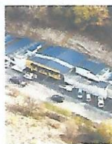
Une association en danger.

Le refuge canin lotois, association implantée au Montat au lieu-dit Combe des Fautillères, accueille un nombre très important de chiens abandonnés, rejetés, maltraités. Aujourd'hui, cette association connaît des difficultés financières pour faire face à un afflux massif d'animaux (soins vétérinaires, achats de nourriture, etc.). Les dirigeants du refuge canin lotois ont lancé un appel aux communes qui, pour certaines d'entre elles, ont accepté de verser une subvention exceptionnelle. Des municipalités ont décidé de communiquer, au moyen de leur site internet, pour sensibiliser la population. Si, demain, cette structure ne peut plus fonctionner et accueillir les animaux abandonnés, perdus, errants ; ce sera une véritable catastrophe pour