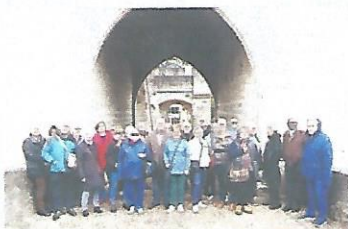
Les délégués régionaux posent sous le Pont Valentré