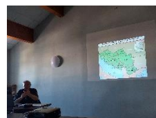
Géopolitique dans le monde balkanique, Bernard DOUMERC, 5 oct 2023, 64 participants