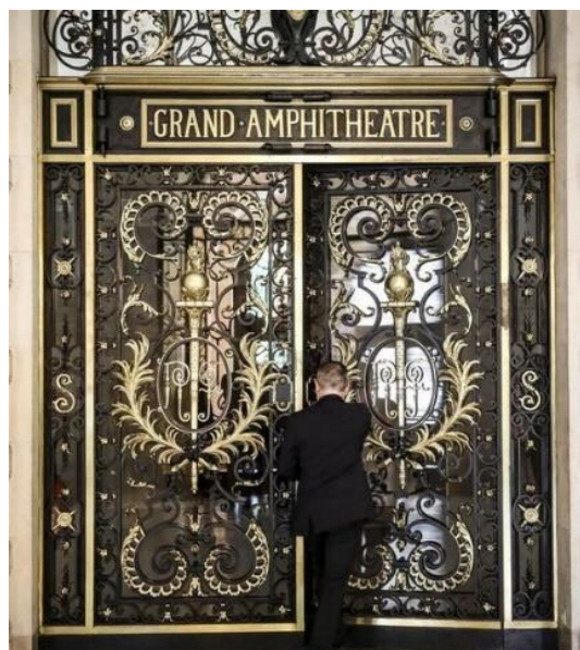
Entrée du grand amphithéâtre de La Sorbonne