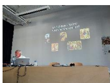
Au-delà du visible : la peinture d'icône, un art au service de la foi, Jacques CALVET, 10 oct 2023, 73 participants