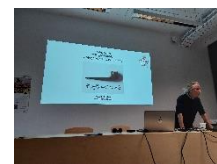
René Magritte et l'inquiétante étrangeté Michel DARNAUD, 19 oct 2023, 72 participants