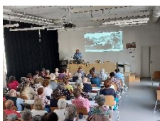
La vie multiple de Colette, Charles KLEIN 3 oct 2023, 98 participants

Un peu plus de 250 adhérents dès le premier mois, dont près d'un quart de nouveaux. Une moyenne de participation très élevée, avec 70 personnes pour chacune des 6 conférences sur des sujets toujours aussi variés.