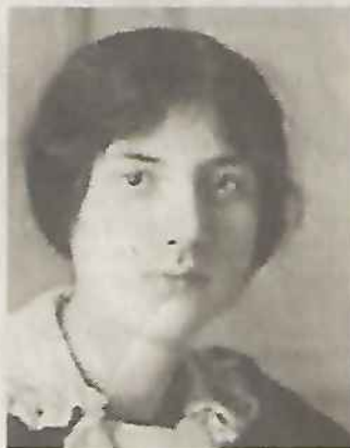
Lili Boulanger était compositrice.

Jusque sur son lit de mort, elle dicte à sa sœur Nadia, égale-