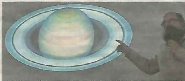
L'un des précédent conférenciers.

De septembre à décembre 2021, la reprise s'est faite « sur les chapeaux de roues » avec pas moins de deux conférences par semaine, sur des sujets très divers, une participation soutenue, entre 40 et 60 participants à chaque séance, et des intervenants au rendez-vous, chaleureusement applaudis pour leurs savoirs, compétences et expérience, pédagogie et leurs passions respectives. Une rentrée également très positive pour la reprise des ateliers, suspendus depuis près de deux ans avec des anciens et de nouveaux participants : ateliers du numérique, atelier photo, ate-